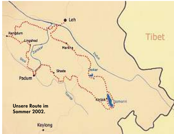
Unsere Route im Sommer 2002.

Das Problem ist die Brücke über den Indus, die unser Tragtier auf keinen Fall betreten will, geschweige denn überqueren. Morup, der alte Mann mit der riesigen Zahnlücke, zieht vorne. Er