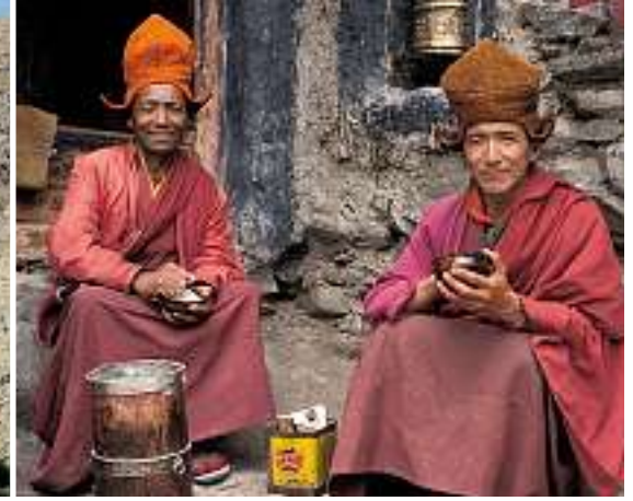
Mönche in einer Arbeitspause beim Buttertee trinken.

Sommer noch zwei Dutzend weitere so hohe Pässe folgen werden.