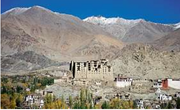
Der alte Königspalast von Leh steht zwar leer, aber in den Strassen und auf den Märkten des Hauptortes herrscht emsiges Treiben.

die 48 Grad in Delhi ein veritabler Schock. In einer dreitägigen Busfahrt, bei der abgesehen vom dauernd plärrenden Radio wahrscheinlich jedes mechanische Teil des Busses einmal geflickt werden muss, flüchten wir in die Kühle der Berge.