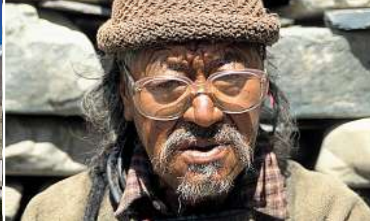
Alter Mann in Kanji. Brillen jeglicher Art sind neuerdings der grosse Hit.

Niedergeschlagen kämpfen wir uns zurück ins letzte Dorf, wo uns die Einheimischen freundlich aufnehmen. Bei Buttertee und Tsampa denken wir über unsere weitere Zukunft nach. Plötzlich läuft die Lösung unseres Problems am offenen Küchenfenster vorbei: ein kleiner Esel mit zwei grossen Säcken auf