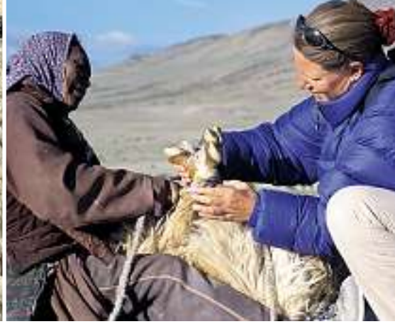
Zwei «Nomadenfrauen» knebeln die Ziege fürs Scheren.