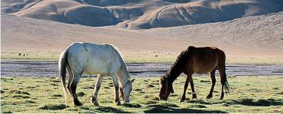
Unsere Pferde Pippi und Paldan geniessen den Feierabend.