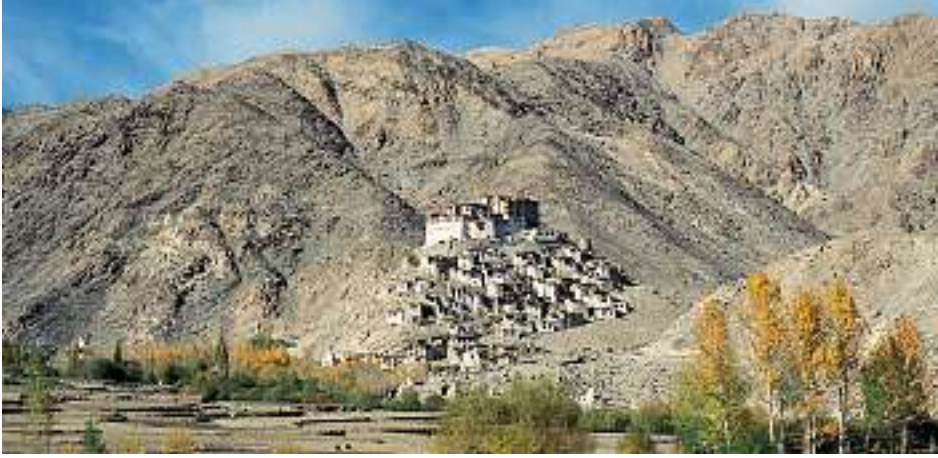
Die buddhistischen Klöster sind stets aufs Neue ein spektakulärer Anblick.