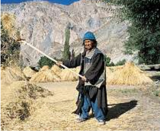
Der Wind trennt Korn und Spreu.