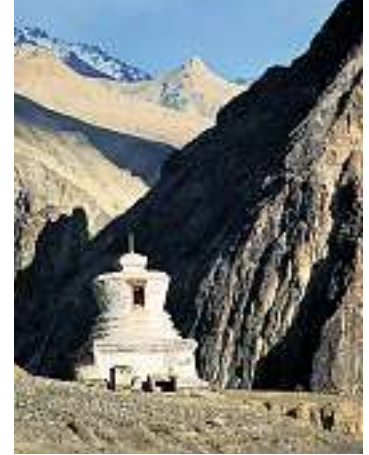
Einsamer Chörten im Markha-Tal.

laya gebracht. Er hat die bösen Böngottheiten bekämpft, besiegt und anschliessend zu Beschützern der buddhistischen Lehre gemacht. Ihm und seinem Wirken begegnen wir immer wieder in Ladakh.