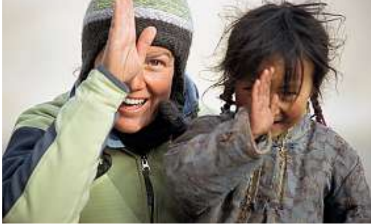
Eingeladen zu Buttertee. Man gewöhnt sich bald an den eigenwilligen Geschmack. Dschullee, der ladakhische Gruss (salopp; sonst mit zusammengelegten Händen).