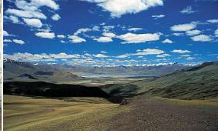
Rupshu-Hochplateau mit Tsokar-See in der Ferne.

mals beim Esel. Zwei Wochen wandern wir im Industal von Dorf zu Dorf, von Haus zu Haus. Nach dieser Zeit kennen wir sämtliche blinden, lahmen und dreibeinigen Pferde, denn das ist alles was uns angeboten wird. Fast schon beginnen wir zu glauben, der Meme hätte wohl recht. Doch da entdecken wir eine weisse Stute, die uns geeignet scheint, und auch ein brauner Wallach steht plötzlich zum Verkauf. Doch so einfach geht's nicht. Die Preisverhandlungen ziehen sich noch weitere zwei Wochen hin. Ein solcher Kauf wird in Ladakh nicht überstürzt. Als wir dann noch eine Flasche Rum auf den Kaufpreis von je ca. 300 Franken «drauflegen», ist der Handel perfekt.