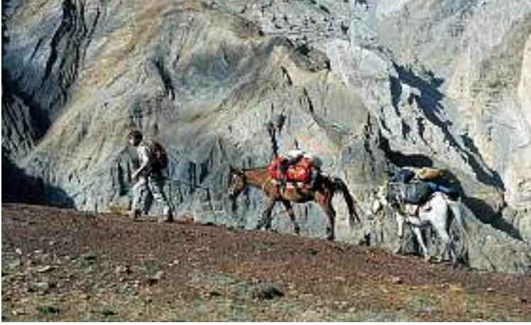
Unterwegs immer in der gleichen Reihenfolge.