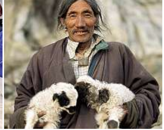
Tibetischer Nomade, der mit seiner Herde vor mehr als 40 Jahren über die Grenze nach Ladakh geflüchtet ist.