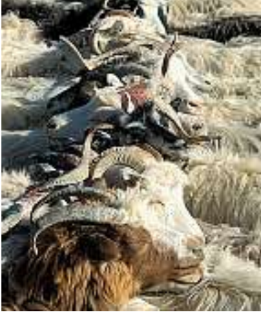
Zum Melken werden die Ziegen in Doppelreihe gestellt, Hörner verflochten.