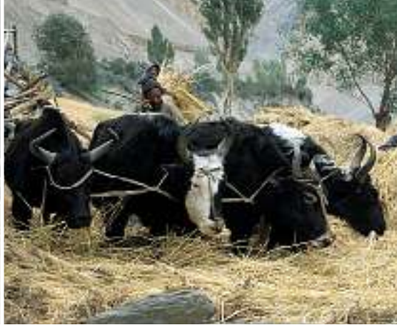
Zum Dreschen braucht man die grössten Yaks.