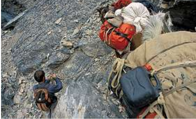
Bröckliges Gestein in steilen Schluchten: Ein Fehltritt könnte das Ende sein.